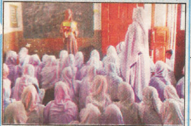
یگورہ سرکاری سکول میں طالبات کو ان کے ۱۶ سے تربیتی ورکشاپ کے دوران لیکچر دیتے جا رہے ہیں

سوات، سرکاری سکولوں اور پرائیویٹ مدارس میں تربیتی ورکشاپ کا اہتمام ورکشاپ میں ہزاروں طلباء و طالبات کو تربیتی کورس کرایا گیا سوات (پونٹو) سوات کے مختلف سرکاری سکولوں اور پرائیویٹ مدارس میں تربیتی ورکشاپ کا اہتمام کیا گیا۔ اس موقع پر سوات کے مختلف سرکاری سکولوں اور پرائیویٹ مدارس میں تربیتی ورکشاپ کا اہتمام کیا گیا۔ اس موقع پر سوات کے مختلف سرکاری سکولوں اور پرائیویٹ مدارس میں تربیتی ورکشاپ کا اہتمام کیا گیا۔ اس موقع پر سوات کے مختلف سرکاری سکولوں اور پرائیویٹ مدارس میں تربیتی ورکشاپ کا اہتمام کیا گیا۔